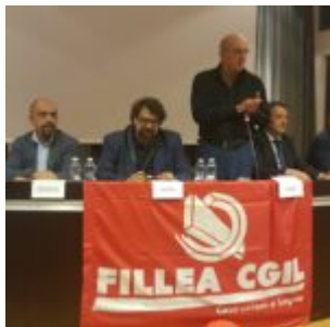
Tavola rotonda con il segretario nazionale Fillea Cgil

scritto da Redazione Abruzzo Popolare | 25 Ottobre 2022