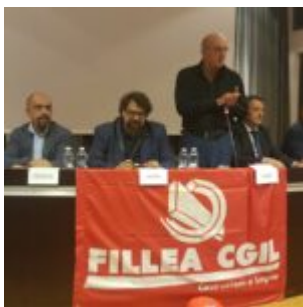
Tavola rotonda con il segretario nazionale Fillea Cgil

scritto da Redazione Abruzzo Popolare | 27 Ottobre 2022