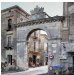
La Porta del Parco delle Maiella

scritto da Redazione Abruzzo Popolare | 8 Novembre 2022