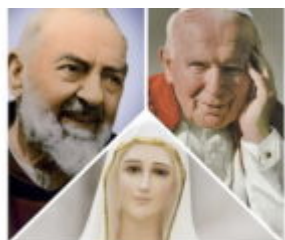
San Pio da Pietrelcina, San Giovanni Paolo II e il segreto della Madonna di Fatima

scritto da Redazione Abruzzo Popolare | 2 Maggio 2023