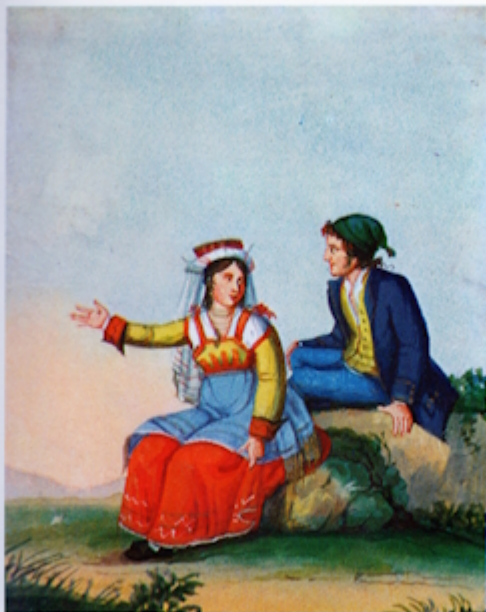
Costume di Schiavi Provincia di Chieti Abruzzo Citra

transumanze, degli spostamenti, delle migrazioni stagionali di questa gente: i maschi realizzano contatti con alterità culturali, con Roma, con la Campagna romana, con la Puglia, pagando in proprio, anche negli abiti, la deidentificazione, mentre la metà femminile, relegata nelle attese nelle terre abruzzesi, diviene depositaria di tradizioni residue. L'opera, a parte il notevole valore delle riproduzioni, è un esempio di antropologia storica, del come un dato specifico, quello del costume materiale, possa essere sollevato a indice di analisi di una storia culturale: ed è violenza subìta il dover constatare che uno studioso come Cerccone, certamente di livello nazionale, debba portare a termine questi lavori nel silenzio della periferia sulmonese, soltanto perché i centri di studio universitari vivono nel facile gioco dei piccoli poteri mortificanti e cancellano le rischiose presenze delle intelligenze". Alfonso Di Nola]