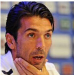
Gigi Buffon inaugura

scritto da Redazione Abruzzo Popolare | 16 Gennaio 2024