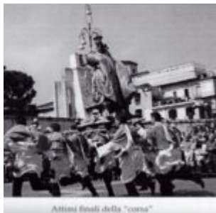
Attimi finali della "corsa"

scritto da Redazione Abruzzo Popolare | 31 Marzo 2024