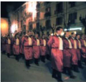
zione Venerdì Santo Coro dei Trinitari .St

scritto da Redazione Abruzzo Popolare | 31 Marzo 2024