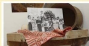
Cantina Anonassé Storie di donne gorianesi