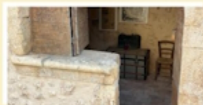
Cancella Rinascimentale Agli Eroi gorianesi