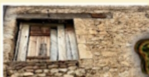
Pagliaio Ad Antonuccio Camponeschi