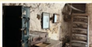
Stalla delle Pecore e delle Capre Alla Migranza