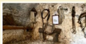
Stalla dell'Asino A Celestino V e al suo asino