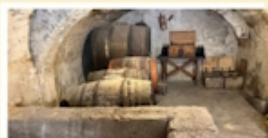
Cantina del Vino A Braccio da Montone