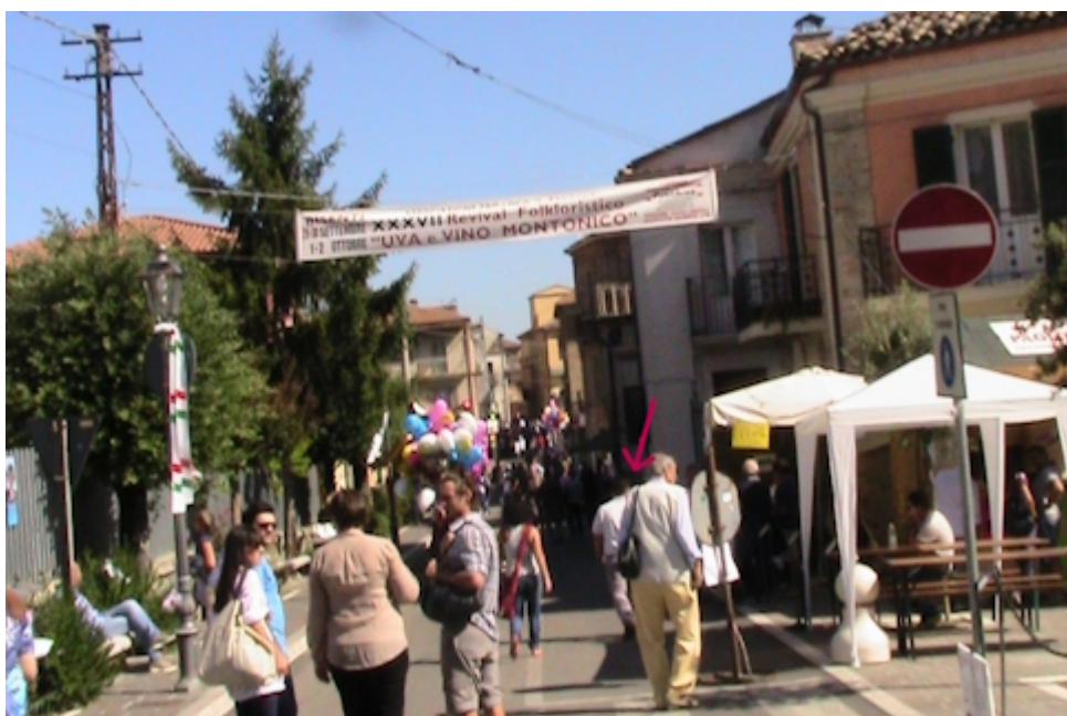
BISENTI. RASSEGNA "UVA E VINO MONTONICO" OTTOBRE 2011. [LA FRECCIA INDICA L'AUTORE DELLA RICERCA.]

[xv] G. Pansa, Miti, leggende e superstizioni dell'Abruzzo , vol. II; Sulmona 1927.