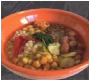
LESSAME, FAVE, FORTI NELLA "COSTA DI MAGGIO"

scritto da Redazione Abruzzo Popolare | 24 Aprile 2024