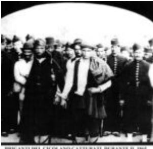
BRIGANTI DEL CIOGLIANO CATTURATI DURANTE IL 1861

[Pubblicato in: AA. VV. "L'Abruzzo nell'Ottocento", Istituto Nazionale Di Studi Crociani; Edgars, Chieti 1996]