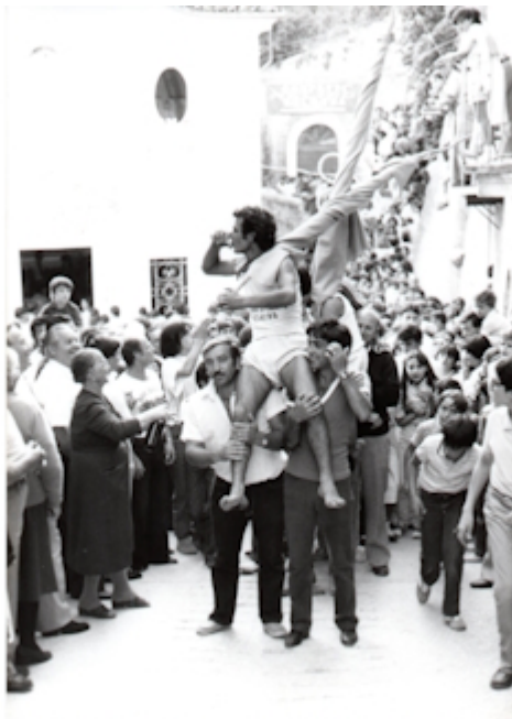
SULLE SPALLE DI AMICI E PARENTI, TRA LA FOLLA, I VINCITORI SONO PORTATI IN TRIONFO. DAVANTI ALLA CASA DEL "PRIMO ARRIVATO" I FESTEGGIAMENTI A BASE DI VINO E CIAMBELLE.