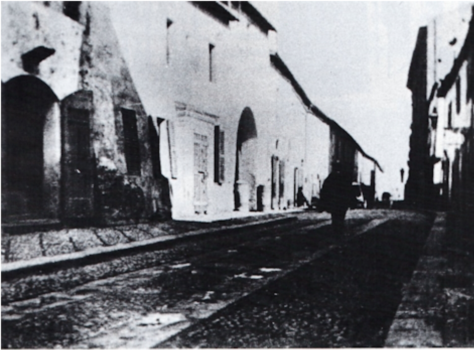
Via delle Caserme