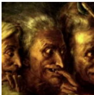
Le streghe di Castel del Monte

scritto da Redazione Abruzzo Popolare | 15 Novembre 2022