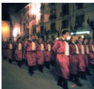
zione Venerdì Santo Coro dei Trinitari .St

scritto da Redazione Abruzzo Popolare | 2 Aprile 2024