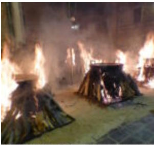
"Za Favate" Palluti. Offerta devozionale delle fave

scritto da Redazione Abruzzo Popolare | 10 Marzo 2024