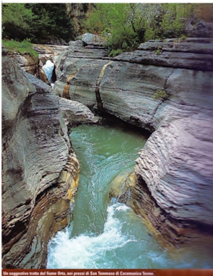
Un suggestivo tratto del fiume Orta, nei pressi di San Tommaso di Caranico Terme.