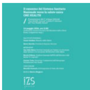
Tavola Rotonda a Roma, 14 maggio

scritto da Redazione Abruzzo Popolare | 10 Maggio 2024