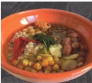
LESSAME, FAVE, FORTI NELLA "COSTA DI MAGGIO"

scritto da Redazione Abruzzo Popolare | 25 Aprile 2024