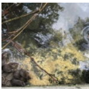
Banchettano con cigni

scritto da Redazione Abruzzo Popolare | 19 Settembre 2023