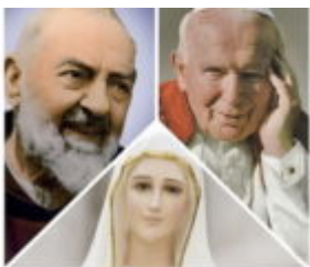
San Pio da Pietrelcina, San Giovanni Paolo II e il segreto della Madonna di Fatima

scritto da Redazione Abruzzo Popolare | 2 Maggio 2023