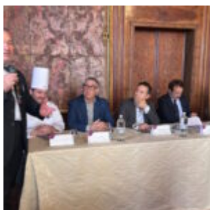
Tavola rotonda al FIET il pane come filo conduttore per un turismo esperienziale e sostenibile. Il pane può diventare un potente strumento di valorizzazione territoriale e culturale, promuovendo un turismo che non è solo esperienziale ma anche autentico e sostenibile

scritto da Redazione Abruzzo Popolare | 12 Novembre 2024