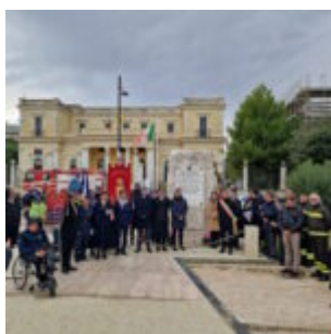
Lapide piazza Dalmazia Giulianova

scritto da Redazione Abruzzo Popolare | 19 Dicembre 2023