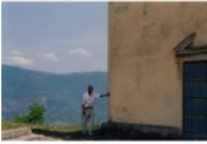
Fig. 1.1. Integrale sito di San Pancrazio Carapelle (luglio 2010)

Estratto Pubblicato in Bullettino Deputazione Abruzzese di Storia Patria "HOMINES DE CARAPELLAS – STORIA E ARCHEOLOGIA DELLA BARONIA DI CARAPELLE" L'AQUILA 1988 Pgg. 125-136