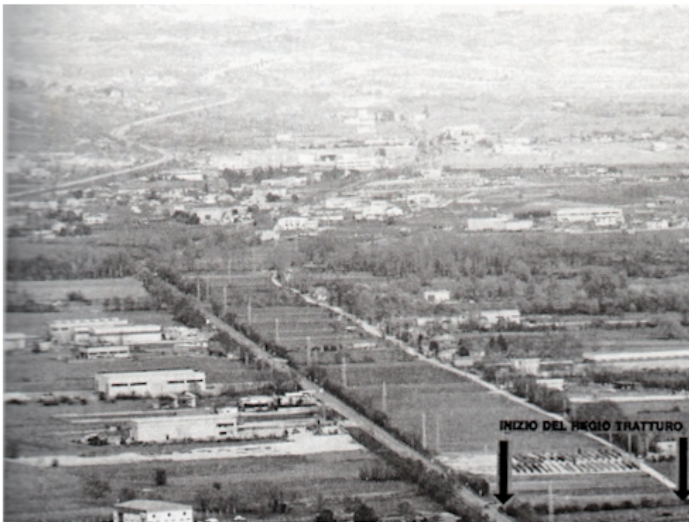
Punto di partenza del Regio Tratturo Celano - Foggia