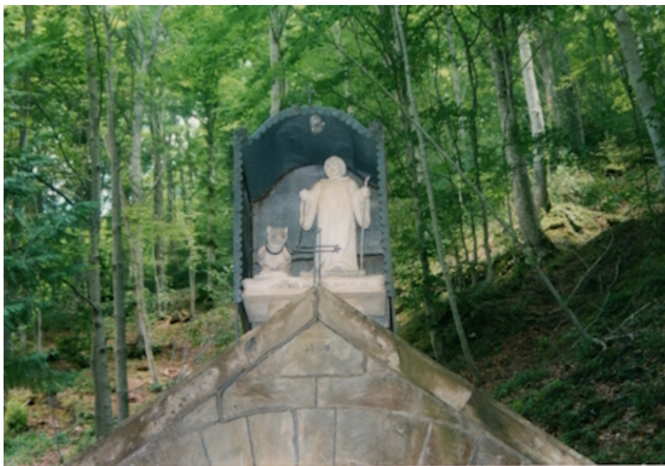
Bosco di S. Amico San Pietro Avellana

Se le vicende biografiche di S. Amico sono caratterizzate dalla massima incertezza, non altrettanto si può dire degli aspetti iconografici con cui è stato rappresentato e tramandato ai posteri sulla base di leggende agiografiche[7].