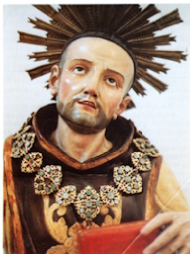
MONACO DEI CELESTINI CAROVILLI (IS.)

Secondo il Ricchiuti, Stefano “fondò nel 1149 il monastero sotto il titolo di San Pietro Apostolo, detto San Pietro di Vallebona”, nei pressi di Manoppello, e di tale località fu anticamente anche protettore[20]. Dal Pansa, che ha pubblicato L'antico regesto del monastero di Vallebona , si apprende invece che la fondazione della chiesa e del monastero appartenuti dal 1285 ai Celestini di S. Spirito a Maiella, “avvenne per opera di Boemondo, conte di Manoppello”. Inoltre sulla base dei manoscritti dell'abate Zanotto[21], risulta che “il monastero in seguito si appellò con diversi titoli. Da San Pietro di Vallebona , titolo di fondazione, passò a chiamarsi Santa Maria di Vallebona ...In un altro strumento del 1576 ed in alcuni privilegi della stessa epoca, si trova cambiato il nome in quello di Santo Stefano di Vallebona ”[22], quel Santo appunto che in tale sede interessa e che assume in seguito l'appellativo “ del lupo ” secondo una leggenda agiografica così riassunta dal Ricchiuti: “ Stefano vien detto del lupo. Avvenne