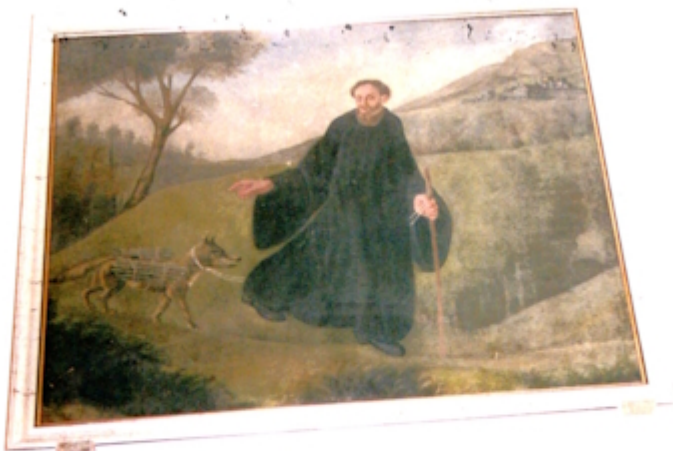
Affresco raffigurante S. Amico ed il lupo "reso mansueto e recante addosso la legna"

Nell'affresco della chiesa di Santa Maria delle Grazie, a Cocullo, S. Amico è raffigurato invece con un'accetta da legna sulle spalle, che richiama semanticamente l'attività svolta dal Santo nel monastero di San Pietro Avellana.